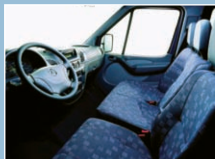
| Variantes. Mercedes Benz ofrece 26 alternativas de Sprinter.