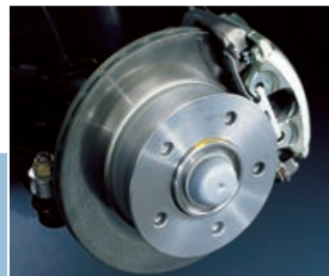
| Pionero. Sprinter incorporó a todos sus modelos ABS, airbag para conductor y Sistema Electrónico de Tracción